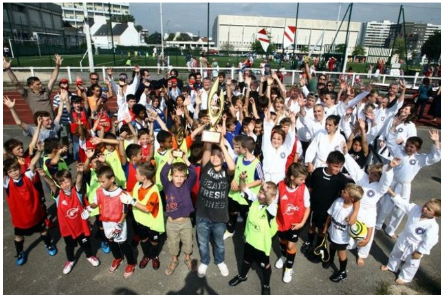
Le Challenge L'équipe 2010 soulevé par des petits Lorientais