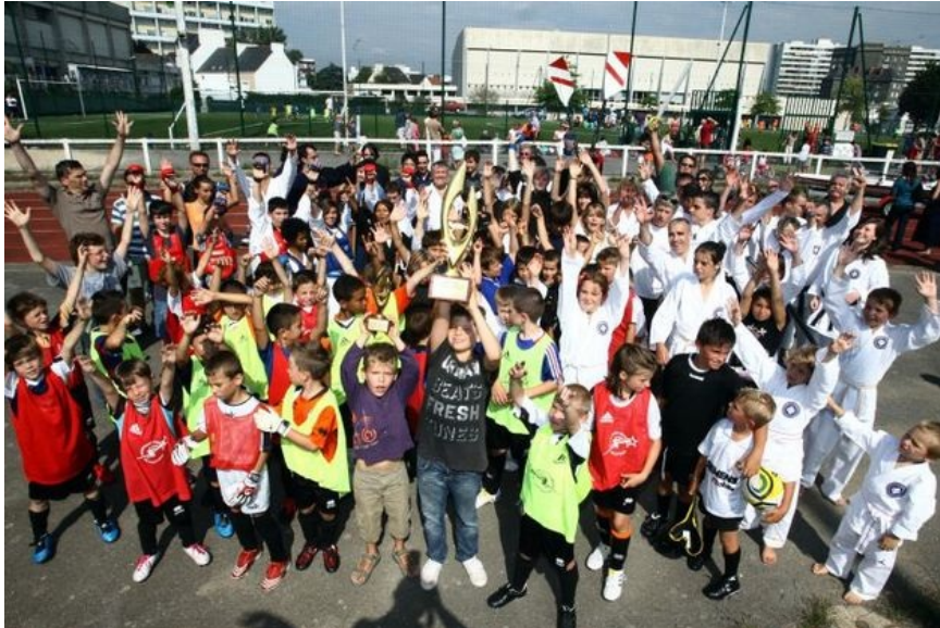
Le Challenge L'équipe 2010 soulevé par des petits Lorientais