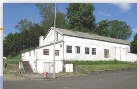
Ancien entrepôt (D 636) - Mi-janvier 2012 à fin février 2012