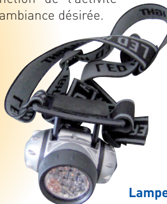
Lampe frontale à 14 LEDs

La température de couleur sera également à prendre en compte dans le choix d'une LED en fonction de l'activité et/ou de l'ambiance désirée.