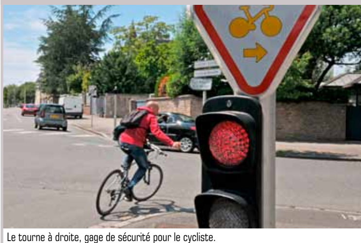
Le tourne à droite, gage de sécurité pour le cycliste.

alors possible pour deux heures, une ½ journée ou la journée. Pour retirer un vélo, il suffit d'accéder à la borne d'accueil, muni d'une carte bancaire, et de suivre les instructions indiquées à l'écran. Une fois le code tapé sur le clavier du guidon, vous voilà parti ! Pour le restituer, il faut se rendre à la station où il a été emprunté. Vous pouvez aussi obtenir un badge auprès d'une des boutiques du service.