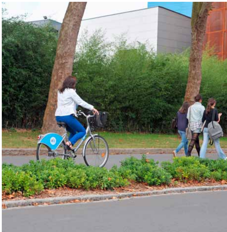
La rue Delessert, une des dernières voies aménagées pour faire du vélo.

tournant à droite et celui des cyclistes.