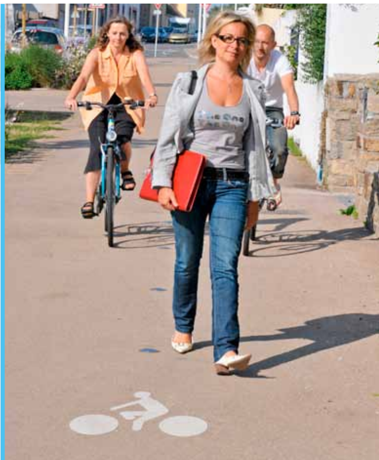
Le partage de l'espace entre les piétons et les vélos est privilégié.