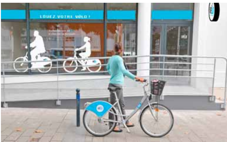
La 1 re boutique du service vélo ouvrira le 13 octobre cours de Chazelles.

Pour ceux qui souhaitent pouvoir se déplacer en toute liberté, quels que soient le jour et l'heure, des vélos sont également disponibles en libre-service 7 j/7 et 24 h/24 dans deux stations : gare SNCF et embarcadère-Quai des Indes. La location est