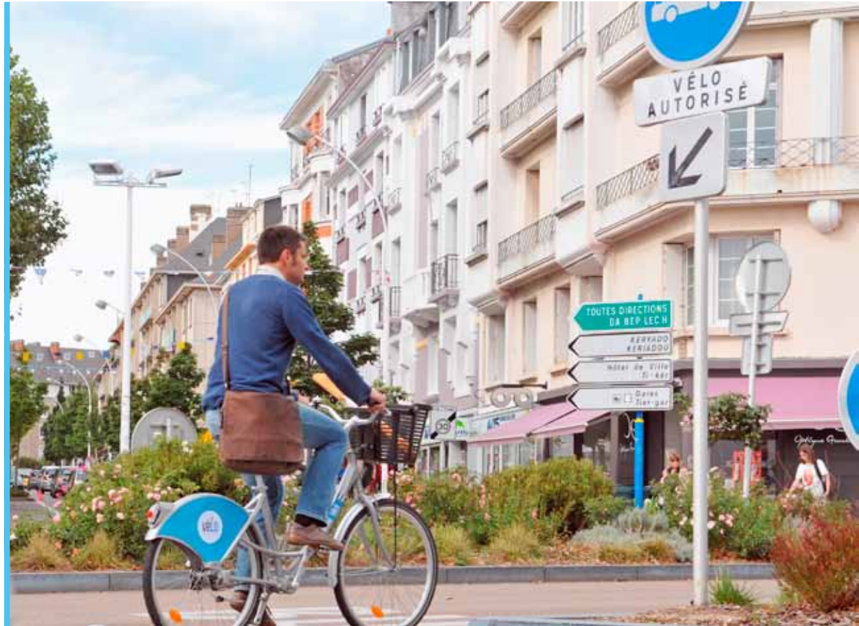
Le vélo, écolo, économique et bon pour la santé.

À compter du 13 octobre, la Ville lance une offre de location de vélos. Ses objectifs : promouvoir le vélo comme mode de déplacement urbain et répondre aux attentes des usagers, réguliers comme les habitants mais aussi occasionnels tels que les touristes. Géré par l'association AGORA, ce service a aussi vocation à fournir des flottes de vélos aux salariés, dans le cadre des plans