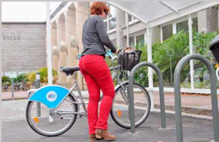
L'un des abris, situé devant la mairie.

De plus, le vélo est un moyen de transport sûr. Dans une enquête réalisée en 2010 sur la ville, les attentes prioritaires des habitants portaient sur le renfort de la sécurisation et sur la mise en place d'aménagements cyclables plus nombreux et plus qualitatifs. Or les études d'accidentologie ont montré que le vélo comme moyen de déplacement n'est pas une source d'accident particulière. À Lorient comme ailleurs.