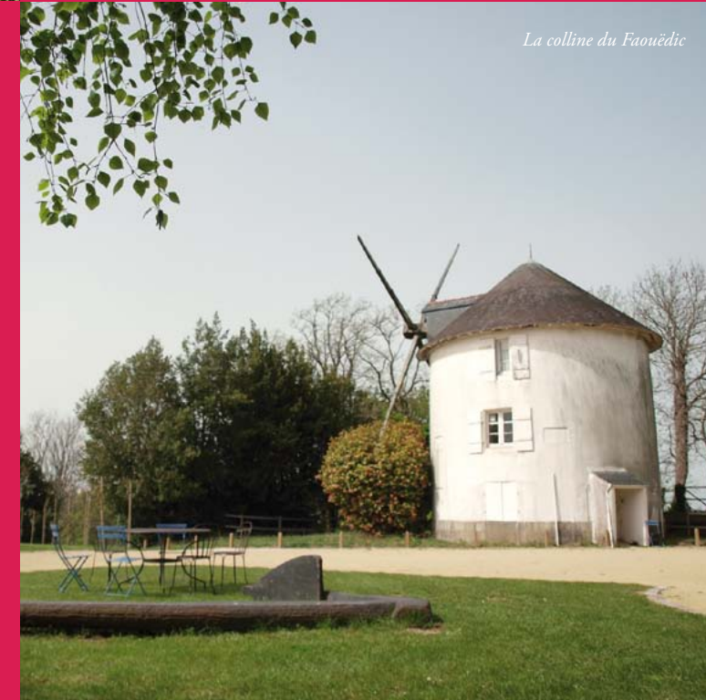
La colline du Faouëdic

Le 16 mars 2006, Lorient signait avec le ministère de la culture la convention Ville d'art et d'histoire ; elle appartient désormais au réseau national des Villes et Pays d'art et d'histoire.