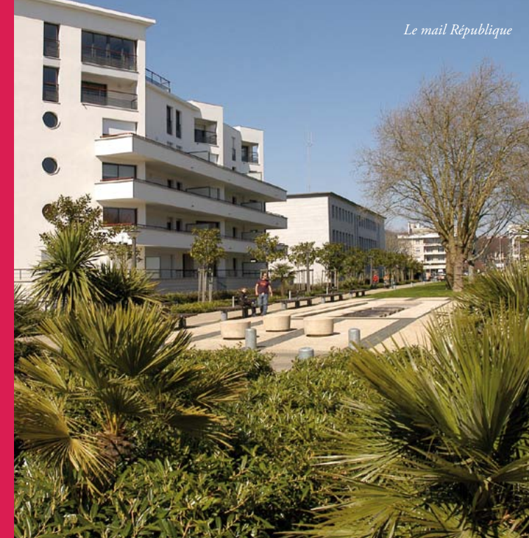
Le mail République

Marquée à la fin du 20 e siècle par les crises de secteurs moteurs de l'économie lorientaise tels que la pêche et le départ de la Marine nationale, Lorient réoriente ses projets urbains, interroge et œuvre pour la reconnaissance des ensembles de la reconstruction tout en multipliant les signatures d'architectes de renom. Inauguré en 2003, le Grand Théâtre vient sceller la fin de la reconstruction et marquer d'un geste fort l'axe autour duquel s'articule le centre ville, du stade du Moustoir au futur quartier de la pointe du Péristyle.